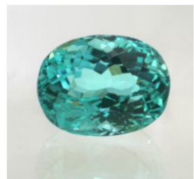
Abb. 4: "Paraiba grüner Fluorit", Etsy

Wenn es um die Verwendung von kunstvollen Namensschöpfungen geht, so ist gleich nach Ebay die Internetplattform Etsy zu nennen. Dort werden z.B. grüne, facettierte "Paraiba"-Fluorite angeboten.