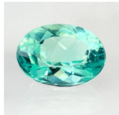
Abb. 1: Paraiba Turmalin, geschliffen

Durch die Zulassung des Namens auch für andere Fundstellen verliert der Originalfundort jedoch an Bedeutung und damit die Steine an Wert, was wiederum zu massiven Protesten brasilianischer Händler und Erzeuger führte. Im April des Jahres 2008 erreichte die internationale Kontroverse um den Begriff „Paraiba“ eine neue Stufe, als David Sherman, Entdecker und Betreiber der Paraiba-Mine in Sao Jose de Batalha (Brasilien)