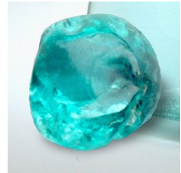
Abb. 5: künstliches Produkt (Glas) alias ("Paraiba"-) Obsidian