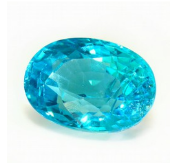
Abb. 2: Probe 8371 (Apatit)