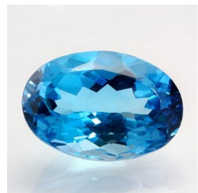
Abb. 3: "Paraiba", Ebay (bestrahlter Topas)

Hier ist anzumerken, dass der Name Paraiba ohne Nennung des jeweiligen (korrekten) Mineralnamens in keinem Fall zugelassen ist, weder bei der bekannten hellblauen, kupferhaltigen Turmalin-Varietät, noch bei einem anderen Mineral. Einen Stein, der nur "Paraiba" heißt, gibt es also nicht.